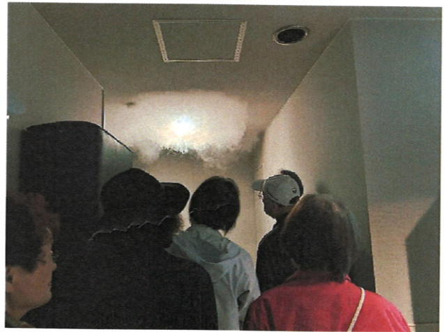
北区防災センターでの煙体験 『ご近助 防災ウォーク』