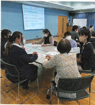
みんなで考える地域の中の困りごとpart13 王子光照苑地域包括ケア連絡会

編集発行 豊島高齢者あんしんセンター 北区豊島3-27-22 電話 6903-2712 王子光照苑高齢者あんしんセンター 北区王子3-3-1 電話 3927-8899