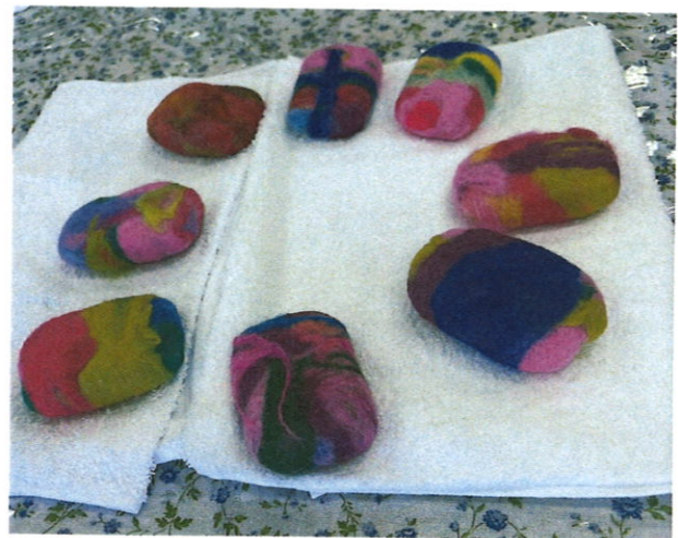
羊毛フェルト石鹸 おひさまサロンにて作成

※この通信は、民生委員、おたがいさまネットワーク協力団体等の皆様にお送りしております。