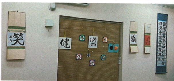
商店街de文化祭 書道塾 皆好会